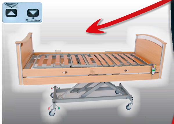
Reglering av sänglyft Sänglyften styrs från manöverdonet. Knappar för UPP resp. NER