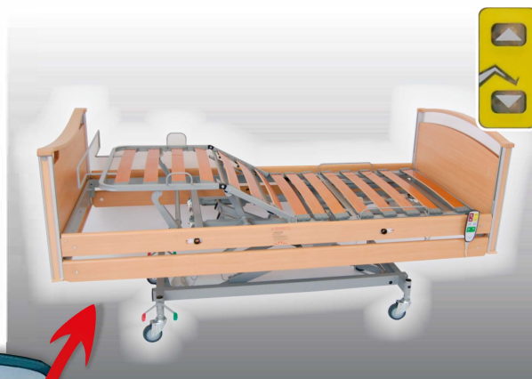
Reglering av lår- och fotdel Lår- och fotdel styrs från manöverdonet. Knappar för UPP resp. NER