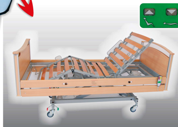
Reglering av komfortläge Sängbotten ställs oavsett tidigare position i sittläge/planläge (liggläge).