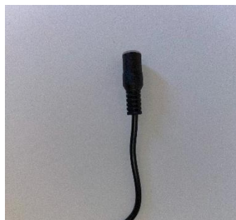
Figur 2 Honkontakt